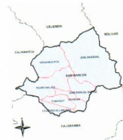
Localización de la Provincia de San Marcos – Cajamarca