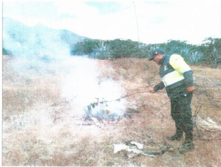
CON RAMAS DE ARBOLES SE A EVITADO LA PROPAGACION DE INCENDIO