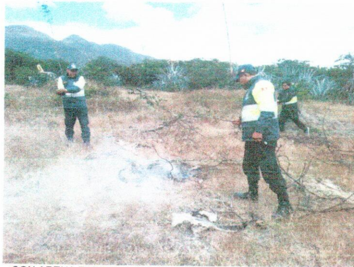
CON ARENA TAMBIEN SE COLABORO PARA ELIMIANIT EL FUEGO