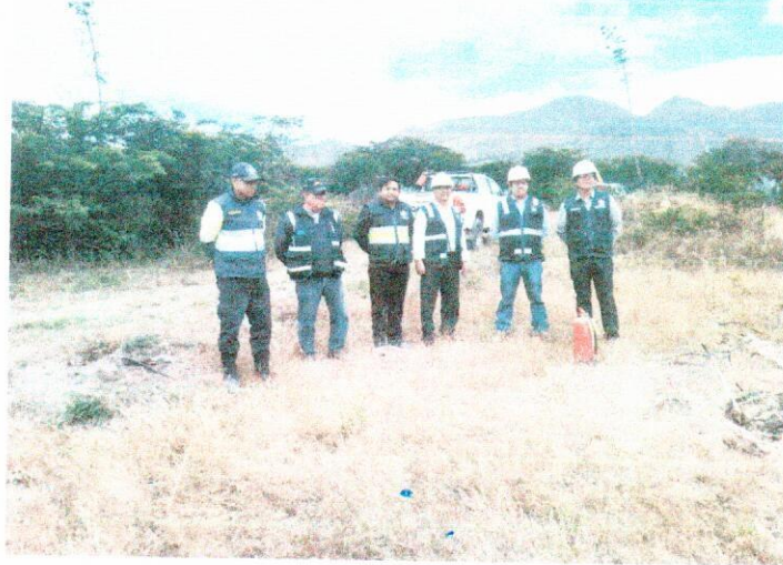
PERSONAL QUE TRABAJO PARA EL SIMULACRO DE INCENDIOS FORETALES