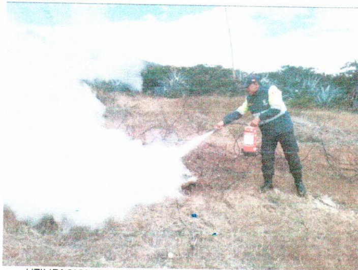
UTILIZACION DEL EXINTOR ANTE EL INCENDIO IMNINENTE