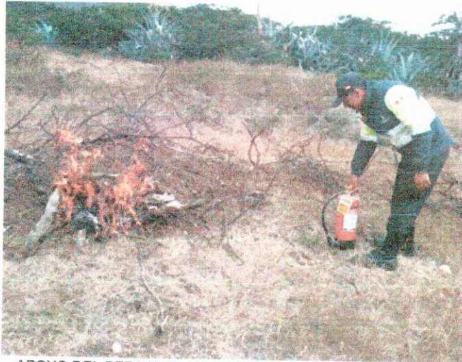
APOYO DEL PERSONAL DE APOYO PARA APAGAR EL FUEGO