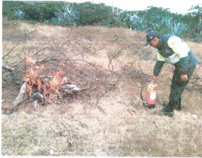
APOYO DEL PERSONAL DE APOYO PARA APAGAR EL FUEGO