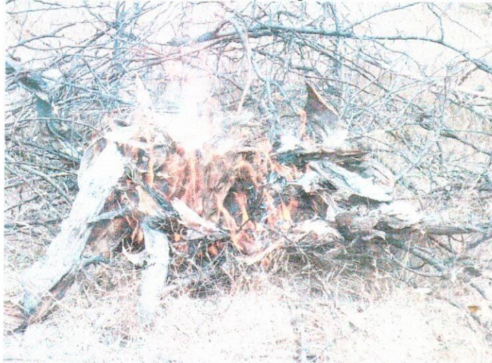
INCENDIO FORESTAL EN LA BERTURENA – MILCO – PEDRO GALVEZ.