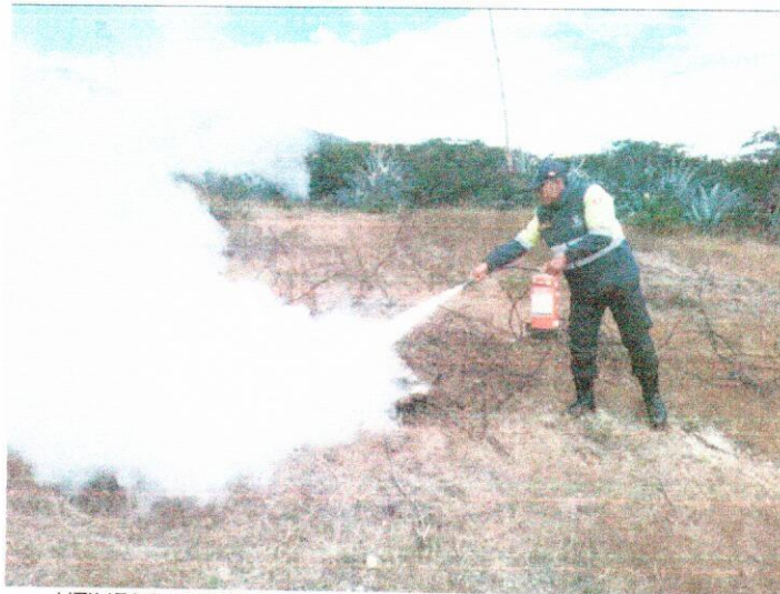
UTILIZACION DEL EXINTOR ANTE EL INCENDIO IMNINENTE