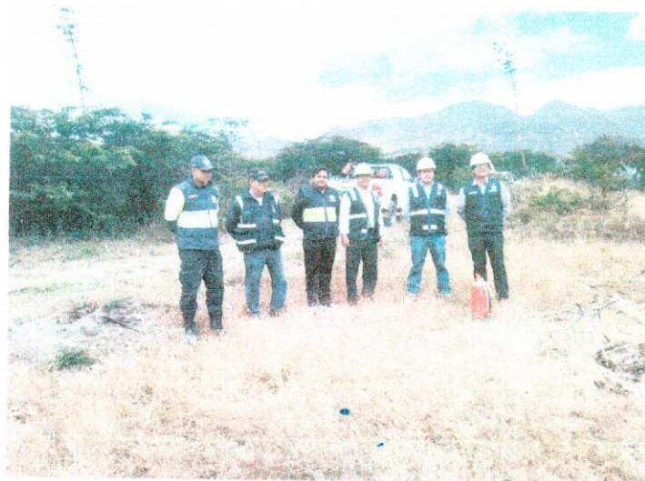
PERSONAL QUE TRABAJO PARA EL SIMULACRO DE INCENDIOS FORETALES